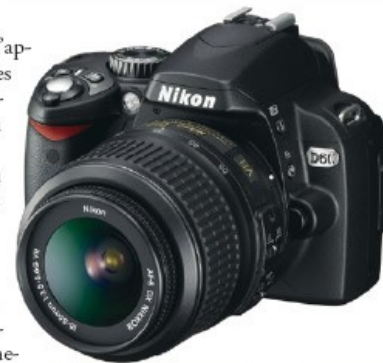
Un exemple d'appareil reflex : le Nikon D60.

Enfin, sachez que la grande taille des capteurs des reflex confère aux photos une profondeur de champ inférieure à celle de clichés issus d'un compact, à cadrage et réglages identiques. C'est pourquoi il sera toujours plus facile d'obtenir de jolis fonds flous avec un reflex.