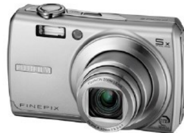
Un exemple d'appareil compact : le Fujifilm FD100fd.

Le renouvellement de la gamme des appareils photo compacts est incroyablement rapide, aussi se sent-on rapidement perdu parmi le nombre de modèles proposés. Par ailleurs, il est difficile de distinguer les critères de choix importants des arguments marketing, même si nous avons déjà pu constater l'intérêt relatif d'un grand nombre de mégapixels par rapport à une taille de capteur avantageuse.